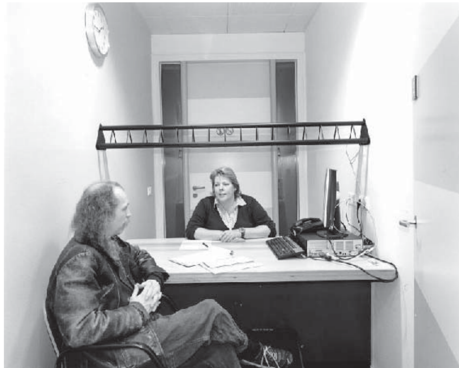
Klantmanagers van de afdeling werk en inkomen ontvangen hun klanten met een bijstandsuitkering in speciale spreekkamers.

In 2007 organiseerde Sportservice Nijmegen samen met Nijmeegse basisscholen en sportverenigingen het stimuleringsproject 'Sport jij al?' voor kinderen