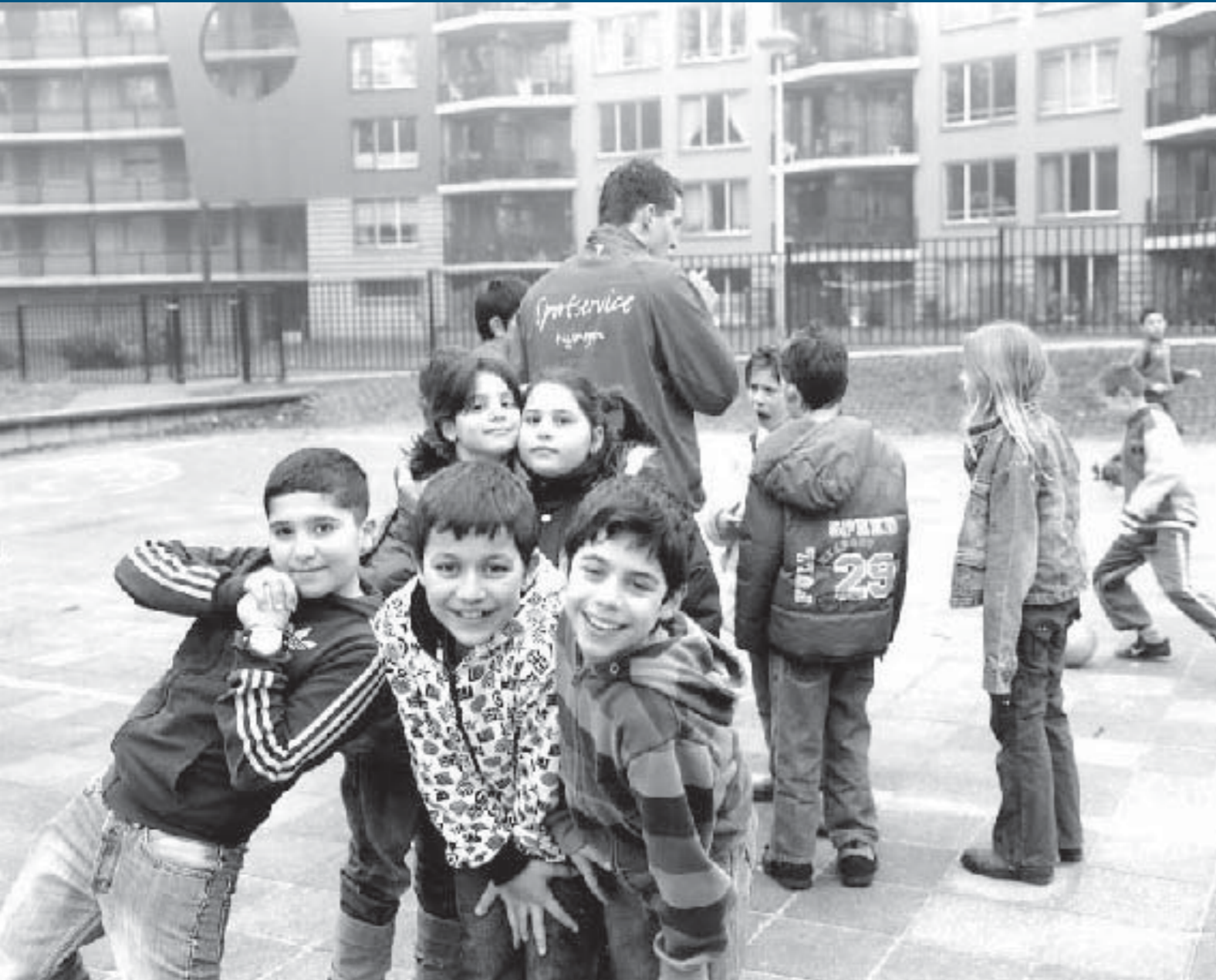
Sportdocenten van Sportservice Nijmegen organiseren dagelijks sportactiviteiten op Nijmeegse scholen en in de wijken.

Wijkbewoners werken steeds meer samen met de gemeente om de leefbaarheid in hun wijk te vergroten. Actieplannen komen in overleg met de wijkbewoners tot stand. Een mooi voorbeeld is het wijkactieplan Hatert. Hatert is door minister Vogelaar als prachtwijk aangewezen. Het actieplan is in een landelijk onderzoek tot het op één na de beste uitgeroepen. Daarbij is ook gekeken naar de aansluiting van het plan bij de wensen van de bewoners. Meer over dit actieplan leest u in het hoofdstuk Burgerparticipatie .