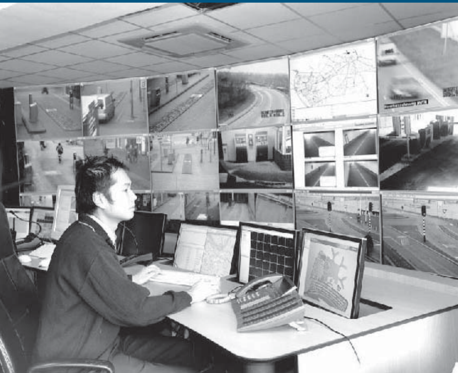
Medewerkers van de verkeersmanagementcentrale houden 24 uur per dag de roadbarrières in de binnenstad en de parkeergarages in de gaten. Alle intercomgesprekken komen in deze kamer binnen.

Uit de Stads- en wijkmonitor 2007 komt naar voren dat de Nijmegenaar zich minder onveilig voelt. In 2005 was dit 3,6%, terwijl dat nu 2,9% is. In de eigen buurt is dat gemiddeld zelfs nog maar 2,5%. Deze trend zien we in ook landelijk terug. Helaas geldt dat niet voor de omgeving van het station. De gevoelens van onveiligheid bij het publiek rondom het Stationsplein, de stationstunnel, het Kronenburgerpark en de tippelzone liggen veel hoger dan we hadden verwacht op grond van de politiecijfers over dat gebied. In 2007 is daarom mobiel cameratoezicht ingezet in de stationstunnel en is er ook betere verlichting gekomen. Binnenkort komen er nieuwe vaste camera's in de tunnel.