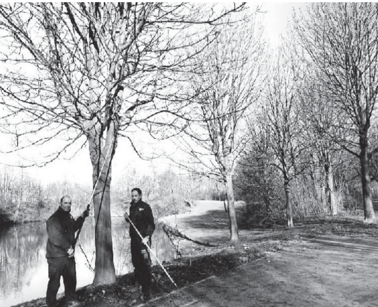
Medewerkers van de wijkserVICETEams gaan aan de slag met vragen en klachten van wijkbewoners. Zij repareren bijvoorbeeld kleine beschadigingen aan het wegdek en doen kleine klussen in het openbaar groen.

De gemeente Nijmegen wil klachten voorkomen door zorgvuldig met haar burgers om te gaan. Ook bereiden we ons goed voor op nieuwe wet- en regelgeving omdat die anders tot veel nieuwe bezwaren kan leiden. De klachten en bezwaren die toch binnenkomen, krijgen een hoge prioriteit. In 2007 hebben deze aandachtspunten tot een daling van het aantal klachten geleid. Daarbij heeft de gemeente een groter deel binnen de termijn afgehandeld en zijn er minder klachten gegrond verklaard. Het niveau van 2005 is nog niet gehaald, maar we gaan wel weer de goede kant op. De cijfers over de bezwaarschriften zijn minder gunstig, de gemeente heeft juist een kleiner deel van de bezwaren binnen de termijn afgehandeld.