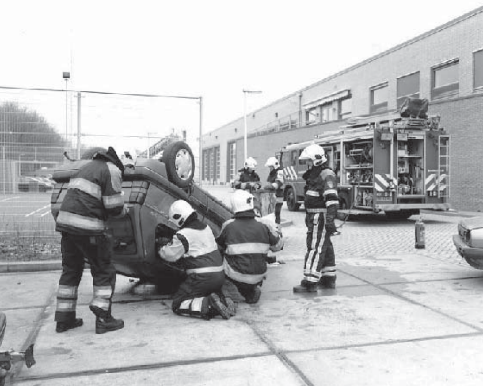
De brandweer blust niet alleen branden, maar schiet ook bij allerlei andere incidenten te hulp. Hier oefenen ze om snel en veilig in te grijpen bij een auto-ongeluk.

tot twaalf jaar. De verenigingen gaven ruim 550 gastlessen tijdens de gymuren. Hier deden in totaal meer dan 12.000 kinderen aan mee. Sportservice Nijmegen ondersteunt sportverenigingen ook bij grote evenementen voor de basisschooljeugd. Voorbeelden uit 2007 zijn: De Local Heroes Run, de mini-elfstedentocht in het Triavium, Gymnastics, het Schoolkorfbal- en Schoolbasketbaltoernooi, Taekwon'do-it' en Judocity Nijmegen. In totaal trokken de jeugdsportevenementen 2.500 leerlingen van de basisschool.